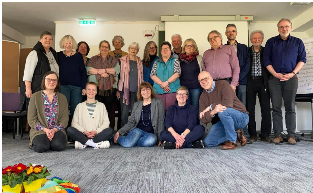
Mitgliederversammlung 2023 in Grünberg

Liebe Mitglieder, liebe TZI-Interessierte, liebe Leserinnen und Leser, im vorliegenden Neuigkeitenbrief finden Sie heute die folgenden Themen: